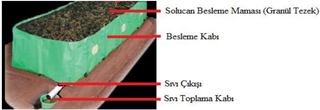
Şekil 2 Sıvı solucan gübresi elde edilmesi

Sıvı solucan gübresi üretiminde kullanılan su örneklerinde analiz edilen bazı parametreler ve kullanılan yöntemlere ait bilgiler Tablo 1'de verilmiştir. Sıvı solucan gübresi üzerinde toplam azot, fosfor, potasyum, kalsiyum, sodyum, berilyum, alüminyum, kükürt, vanadyum, krom, mangan, demir, kobalt, nikel, bakır, galyum, arsenik, selenyum, rubidyum, stronsiyum, gümüş, kadmiyum, sezyum, kurşun, kuru madde ve pH parametreleri analiz edilmiştir. Yapılan analizler ve kullanılan yöntemler Tablo 2'de sunulmuştur.