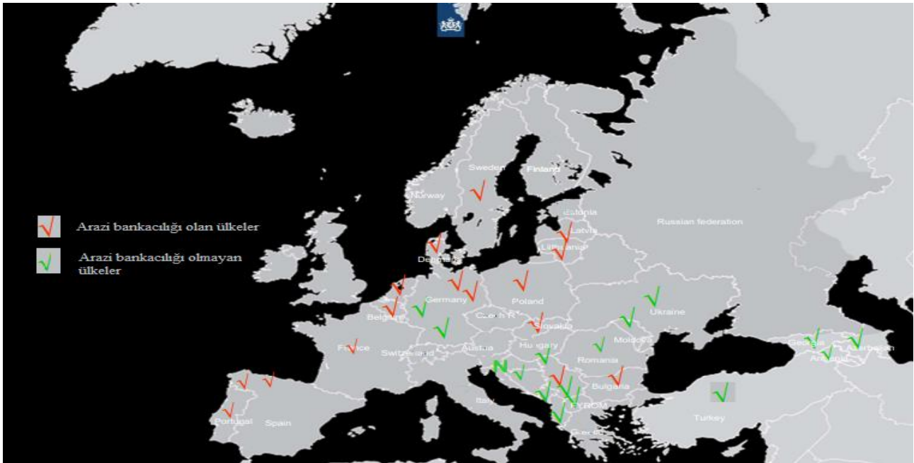
Şekil 2 Avrupa'da arazi bankacılığı (van Holst, 2015) Figure 2 Land banking in Europe

Tablo 1'de Avrupa ülkelerinden Hollanda, Almanya, Fransa, İspanya ve Belçika'daki arazi bankacılığı sistemi karşılaştırılmalı olarak ortaya konulmuştur. Buradan her ülkedeki arazi bankalarının kurumsal, örgütsel ve finans yapılarında farklılıkların olduğu anlaşılmaktadır. Bu da arazi bankacılığı sisteminin ülkelerin ihtiyaçları ve tarımsal yapısı gözetenilerek oluşturulduğunu göstermektedir. Örneğin Fransa'da arazi bankacılığı sistemi özel şirketler (SAFER) aracılığıyla sürdürülürken, İspanya'da kamu kurumu olarak varlığını devam ettirmektedir. Almanya'da ise eyalet bazında değişimler söz konusudur. Aynı zamanda Hollanda ve Fransa gibi ülkelerde toplulaştırma çalışmaları arazi bankacılığı sistemiyle bütünleşmiş şekilde yapılmaktayken, Almanya ve Belçika gibi ülkelerde altyapı yatırımları için kamulaştırma yoluyla arazi edinimi ön plana çıkmaktadır.