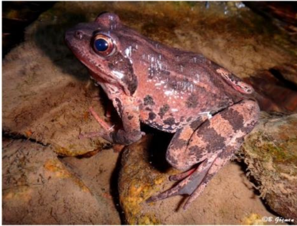
Şekil 4 Rana macrocnemis