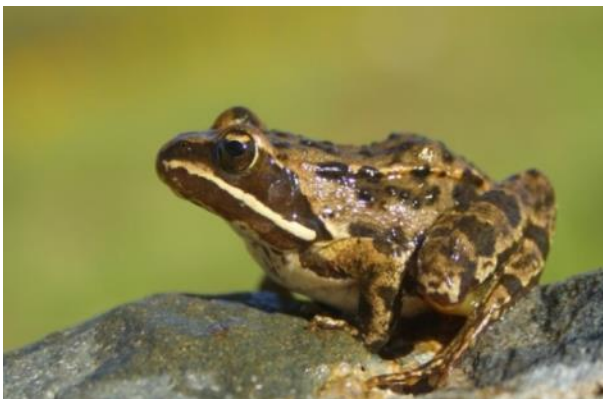
Şekil 6 Rana holtzi

Kurbağa bacağı ihracatında Türkiye'nin en büyük rakipleri Çin, Endonezya, Tayland ve Vietnam gibi uzakdoğu ülkeleridir (Martin, 2000; Eurostat, 2010). Bilhassa Endonezya, kurbağa üretiminde son 20 yıldan beri bu sektöre liderlik etmekte olup Türkiye'nin en önemli rakibidir (Mirsaeed ve ark., 2014). Avrupa ülkeleri arasında en çok kabul gören ise Türkiye'den giden kurbağalar olmaktadır. Bunun nedeni Avrupa ülkeleri tarafından istenen kriterler ve hijyen şartlarının yerine getirilmesinden kaynaklanmaktadır. Kurbağa bacağı, lüks restoranlar da cazip bir yiyecek olmakla beraber Türkiye'de tüketimi düşüktür ve sadece İtalyan, Fransız restoranlarının yanı sıra güney sahil şeridindeki tatil köylerinde tüketilmektedir (İnan, 2004; Çağiltay ve ark., 2014).