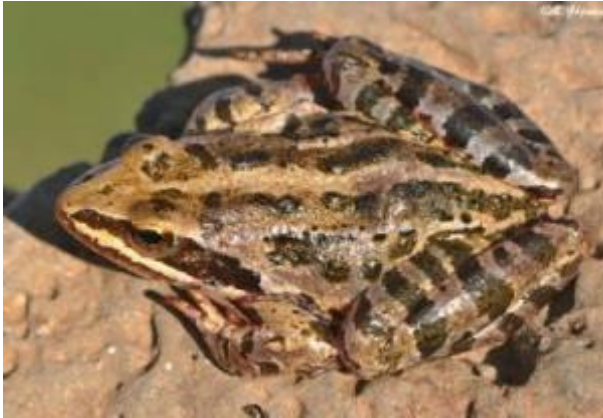
Şekil 5 Rana camerani