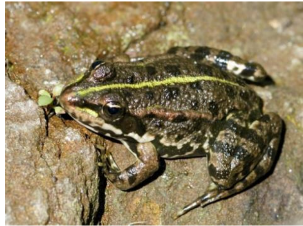
Şekil 1 Pelophylax ridibundus