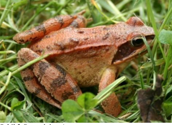
Şekil 3 Rana dalmatina