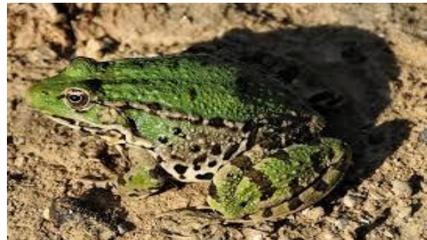
Şekil 2 Pelophylax bedriagae